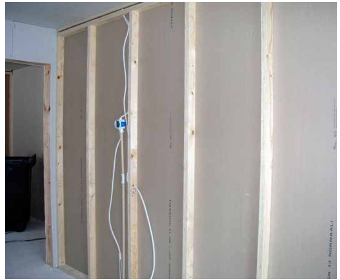
Kuva 3. Kerto-väliseinätolpat