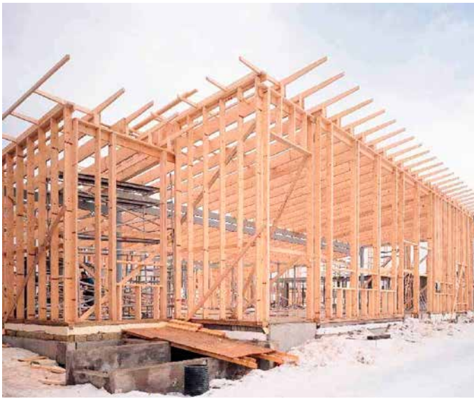
Kuva 2. Kerto-runkotolpat