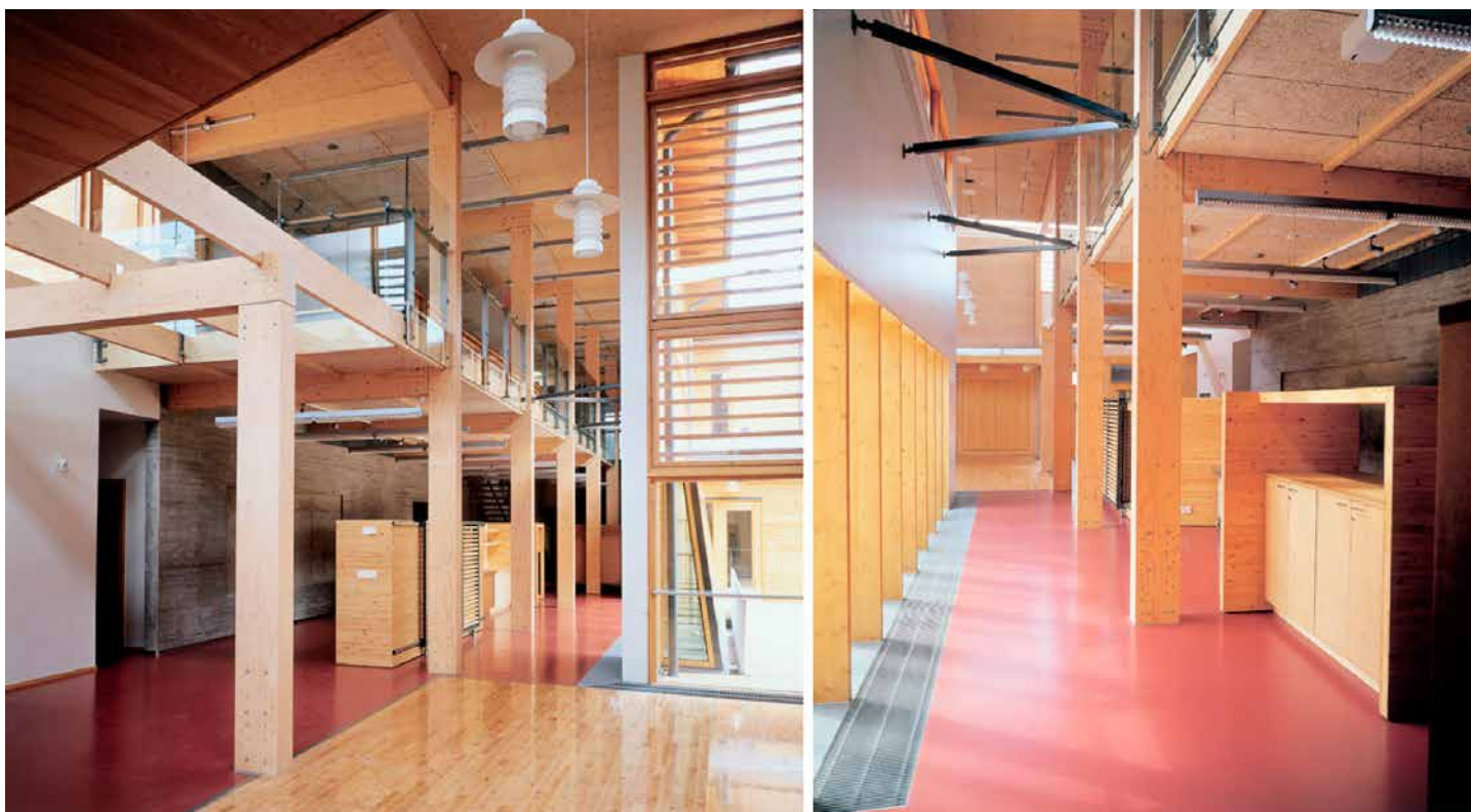
Kuva 1. Kerto yhdistetyissä pilareissa